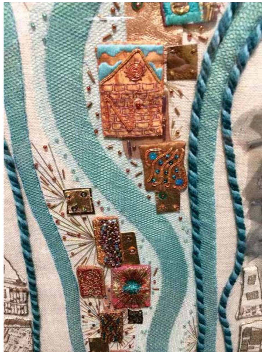
Manyllyn o Frodwaith Abertawe yn defnyddio edau gopr ddrudfawr

a gyda chefnogaeth ariannol y cynllun prynwyd gwéydd cyfrifiadurol Dolby i'w galluogi i gynhyrchu a dylunio'n ddigidol hefyd. Mae'r gwéydd yn adnodd gwerthfawr i fyfyrwyr tecstilïau, ac yn waddol pwysig o'r cynllun. Thema'r myfyrwyr oedd Llwybrau Pererinion ac wedi ymchwilio mapiau yng nghasgliadau'r Llyfrgell Genedlaethol,